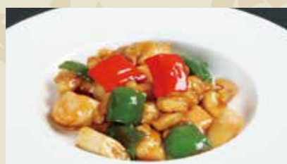
2 鶏肉とカシューナッツの炒め