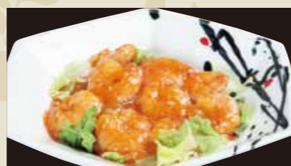
3 エビのチリソース