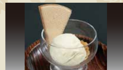
2 プレミアムアイス