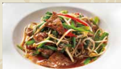
10 牛レバーとニラの炒め