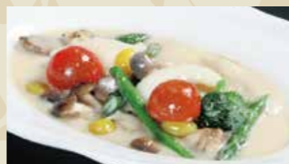
11 イカと野菜のクリーム煮