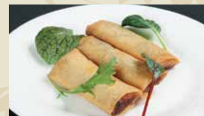
4 春巻 2本