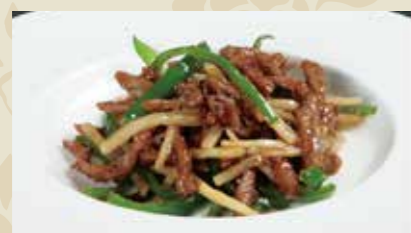
1 チンジャオロース