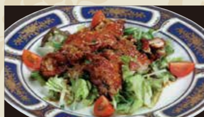
4 鶏のからあげユーリンソース