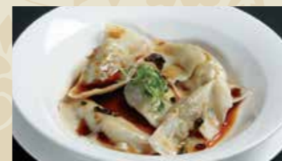
3 水餃子 4個