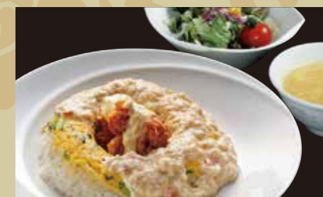
桃華の親子丼 ¥900 (税込¥990)