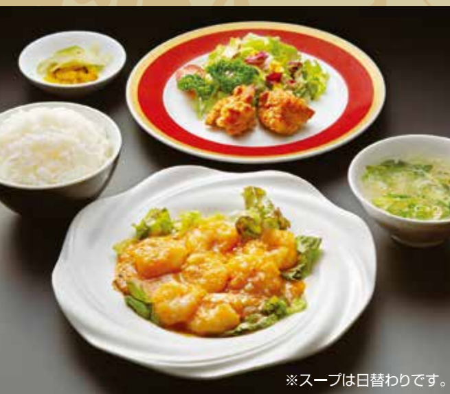
エビチリ定食 ¥1,200 (税込¥1,320)