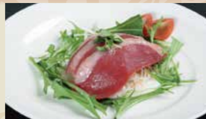
2 くんせい鴨のオードブル