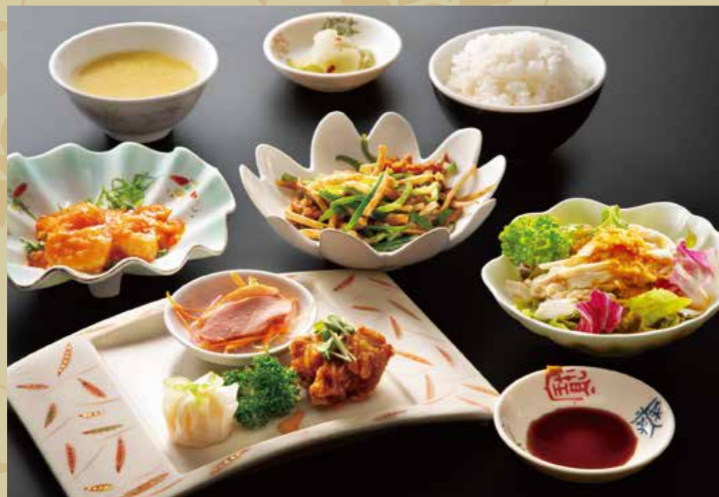
スペシャルランチ ¥1,200 (税込¥1,320)