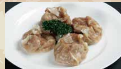
2 焼売 4個