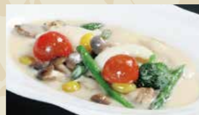
11 イカと野菜のクリーム煮