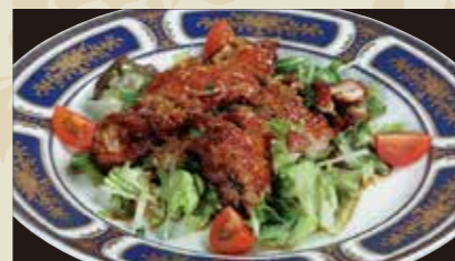
4 鶏のからあげユーリンソース