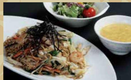
上海風焼きそば ¥850 (税込¥935)