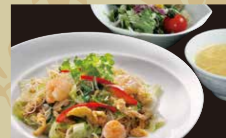
野菜たっぷり焼きビーフン ¥900 (税込¥990)