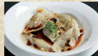
3 水餃子 4個