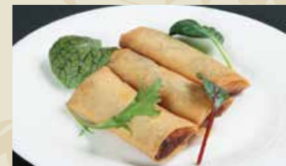
4 春巻 2本