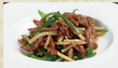
1 チンジャオロース