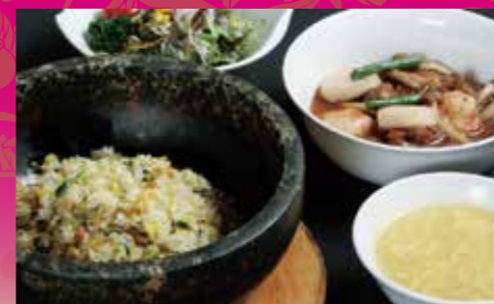
石鍋入りあんかけ (牛肉・ホタテ・エビ) チャーハン ¥1,150 (税込¥1,265)