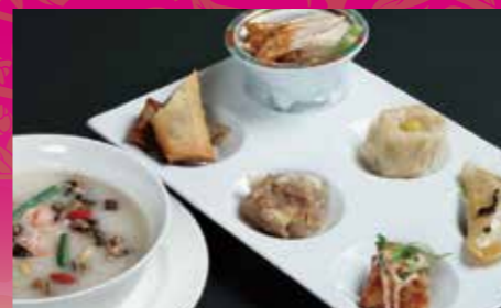
中華粥セット ¥1,100 (税込¥1,210)