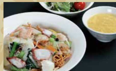
海鮮あんかけ揚げそば ¥850 (税込¥935)