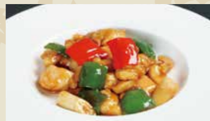
2 鶏肉とカシューナッツの炒め