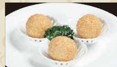
3 ごま団子 2個