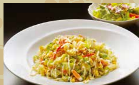
レタスカニチャーハン ¥850 (税込¥935)