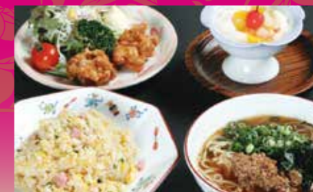
レディースセット ¥1,050 (税込¥1,155)