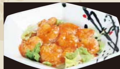
3 エビのチリソース