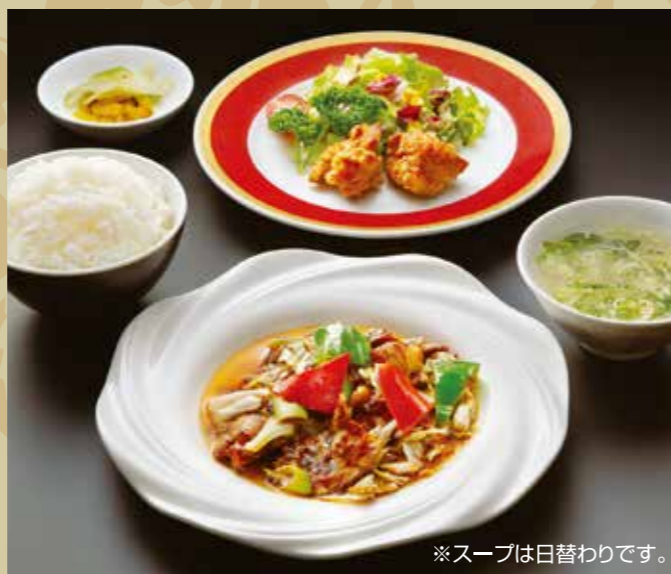
ホイコーロー定食 ¥950 (税込¥1,045)