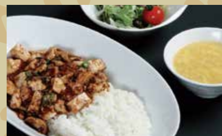
マーボー丼 ¥1,000 (税込¥1,100)