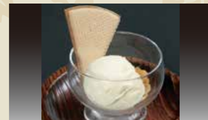
2 プレミアムアイス