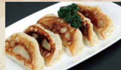
1 餃子 4個