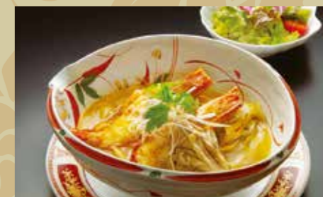
有頭海老の特製ラーメン ¥1,200 (税込¥1,320)