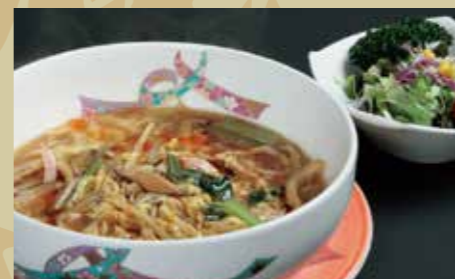
サンラタンメンセット ¥850 (税込¥935)