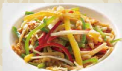
12 黄ニラと豚肉の炒め