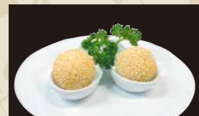
3 ごま団子 2個