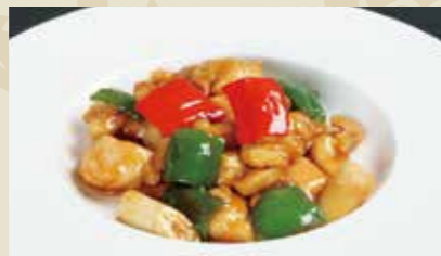
2 鶏肉とカシューナッツの炒め