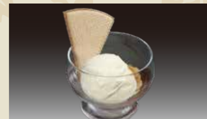
2 プレミアムアイス