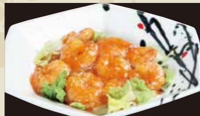
3 エビのチリソース