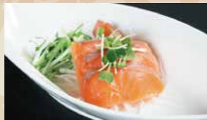
4 日替わり魚のオードブル