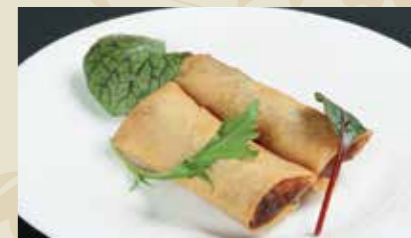
4 春巻 2本