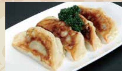
1 餃子 4個