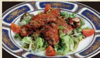
4 鶏のからあげユーリンソース