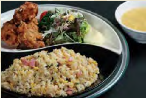
唐揚げ 炒飯セット