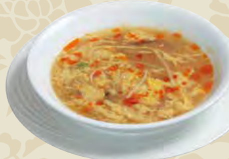
サンラーズープ 酸辣湯