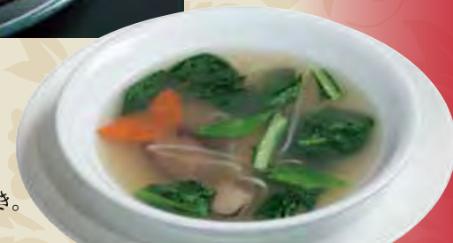
フカヒレスープ 魚翅湯