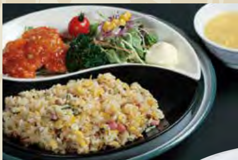
エビチリ 炒飯セット